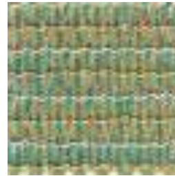
611 RIVERGUM GREEN