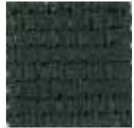
078 BRUNSWICK GREEN