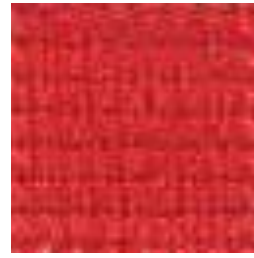
662 CHERRY RED