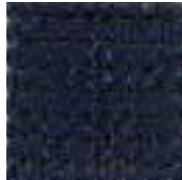
735 NAVY BLUE