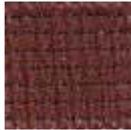
617 OCHRE RED