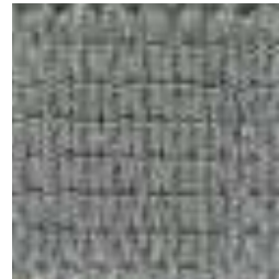
648 STEEL GREY