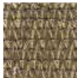
804 MELANGE HAZELNUT