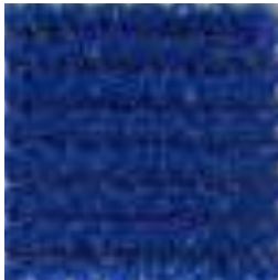
766 AQUATIC BLUE