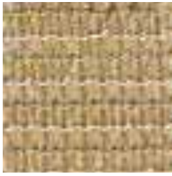
704 DESERT SAND